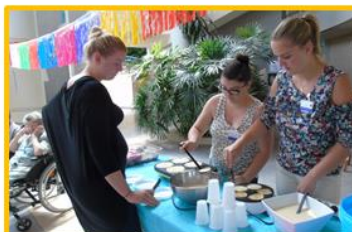
Venue des élèves aides-soignants de l'IFSI de Villefranche.

Des groupes d'élèves ont pris en charge les résidents autour d'un panel d'ateliers : lecture du journal, promenades, manucure... L'après-midi, les élèves et les résidents ont participé à un goûter crêpes party, danses et chants.