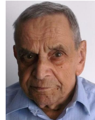
Service LES GARENNES