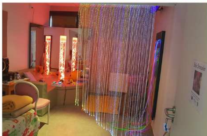
Salle Snoezelen - Batiment J. Chauviré

Le projet est d'aménager des espaces Snoezelen dans les lieux de vie des résidents en installant du matériel adapté (fibres optiques et projecteur d'images). En rendant cet outil plus accessible aux professionnels, nous souhaitons améliorer l'accompagnement des résidents au quotidien.