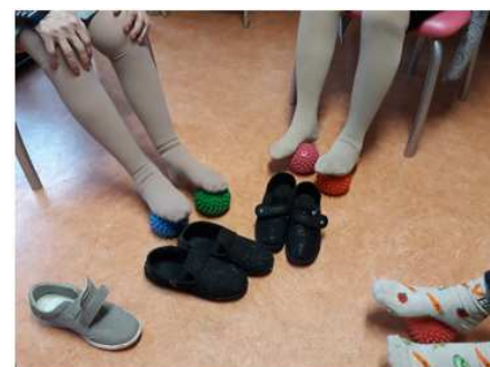
Utilisation de balles à picots pour stimuler la voûte plantaire

Le psychomotricien contribue au bien être psychocorporel de la personne âgée.