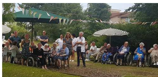
Inauguration du poulailler en présence des résidents, familles et professionnels

Le projet de mise en place d'un poulailler dans l'EHPAD s'inscrit dans le cadre du projet institutionnel des EHPAD dont le fil conducteur est de valoriser le rôle social des résidents. Ce projet comporte une dimension sociale et thérapeutique.