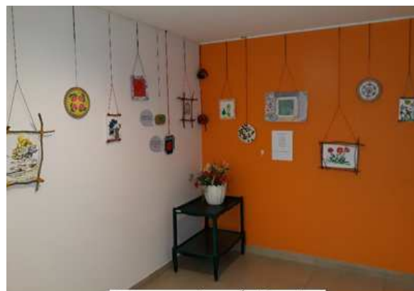
Œuvres des résidentes

Depuis mi-juin dernier, quelques œuvres des résidents sont exposées dans le hall d'entrée du pavillon Jacques Chauviré. L'objectif de l'exposition est de proposer un autre regard sur la personne âgée atteinte de démence et de communiquer auprès des familles sur le quotidien des résidents, notamment les activités proposées.