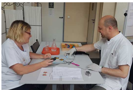
Gants simulant des tremblements