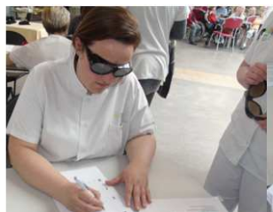
Lunettes simulant une dégénérescence maculaire ou la cataracte ou un glaucome..