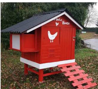
Poulailler du Val d'Or, fabriqué par l'équipe des Parcs et Jardin du CHG

Le projet de mise en place d'un poulailler dans l'EHPAD s'inscrit dans le cadre du projet institutionnel des EHPAD dont le fil conducteur est de valoriser le rôle social des résidents. Ce projet comporte une dimension sociale et thérapeutique.